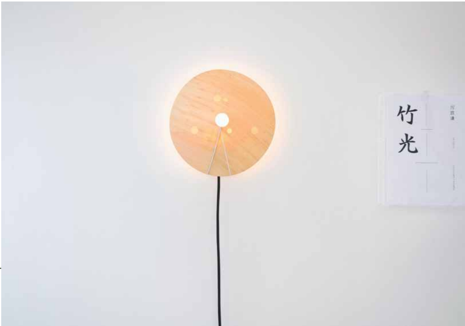
竹子可以壓成薄薄的竹片，製作輕透的燈罩。